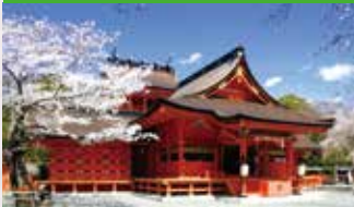
⑦富士山本宮浅間大社