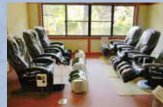
リフレッシュコーナー

コインマッサージ機などを設置しておりますので、登山などで疲れた体を癒して下さい。